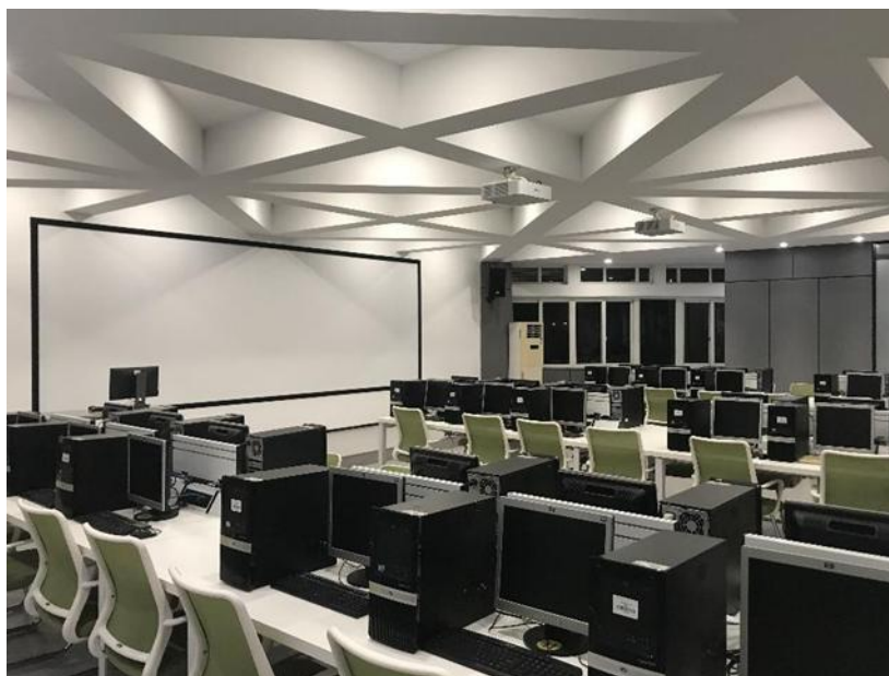
图 2 安恒共建网络安全攻防实训室

安恒信息安全学院建设有校内实训室、校企共建实训基地、校外实践基地等三类实训实践基地。校内实训室主要承担校内课程的授课与实训，以及网络安全培训基地的对外培训、网警训练、CTF 竞赛等；校企共建实训基地主要承担产教融合协同育人与对外技术服务工作，合作公司在对外服务项目中提供学生职业项目带教服务；校外实践基地为学生提供暑期实践、专业顶岗实习和毕业综合实践等项目。此外与杭州安恒共建的实训平台还有网络安全攻防平台、态势感知平台和安恒风暴中心。