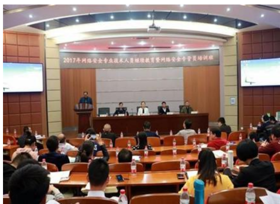
图 3 温州市网络安全专管员培训

Web 安全监测与人工验证、安全系统集成、温州市网络安全员培训等技术服务工作,先后为鹿城区公安局、瓯海公安局等提供辖区 600 多个 Web 网站的监测服务。另一方面,依托杭州安恒公司作为技术和平台支撑单位,举办温州市网络安全专管员培训和网络安全 CTF 大赛等。