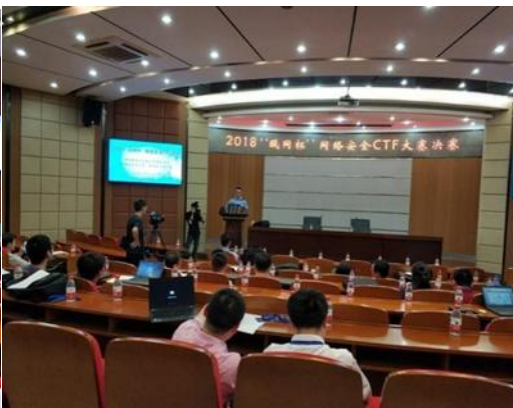
图 4 温州市瓯网杯网络安全CTF 大赛决赛